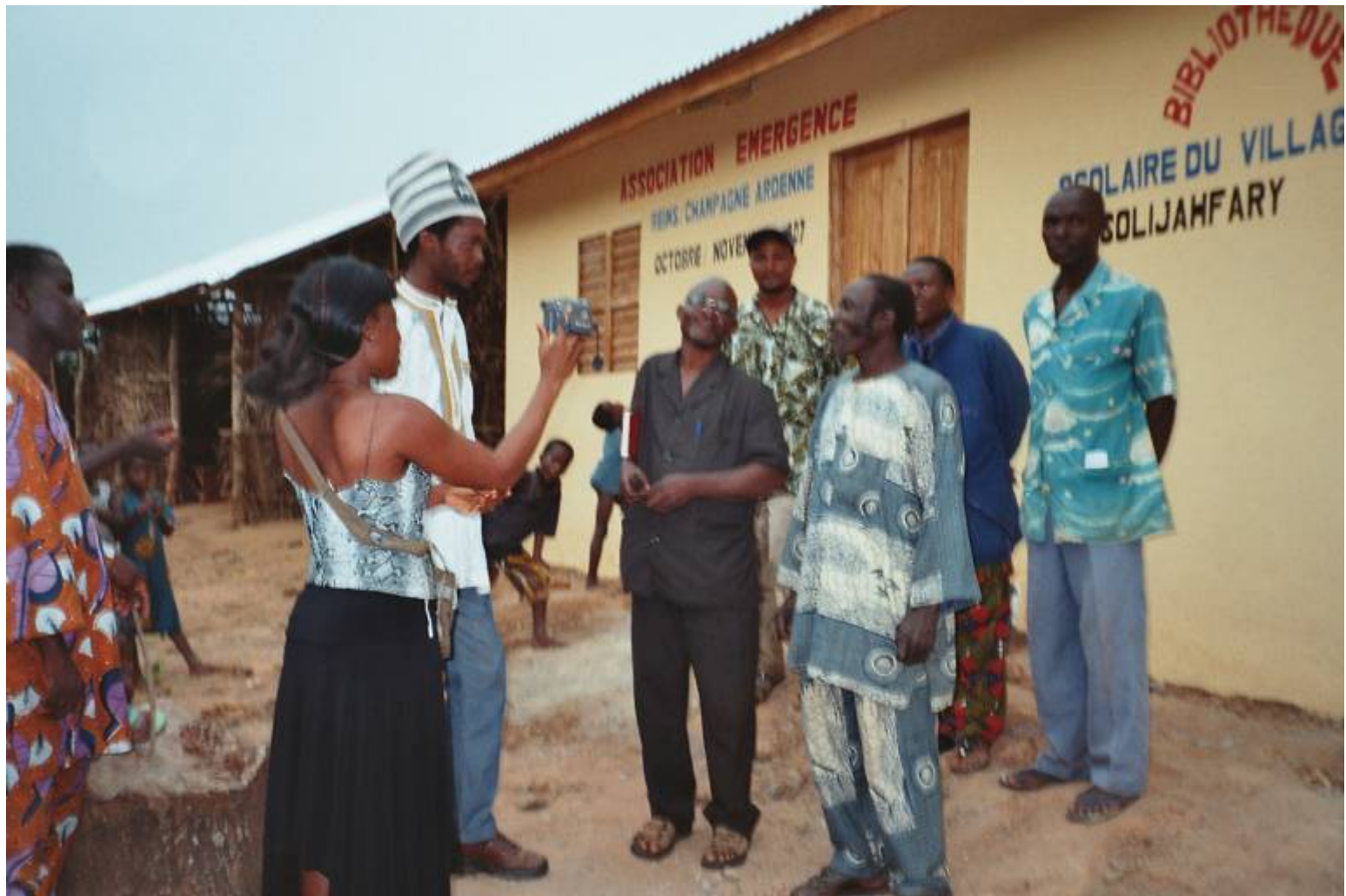
Séance d'interview vidéo avec l'APE, le directeur d'école.