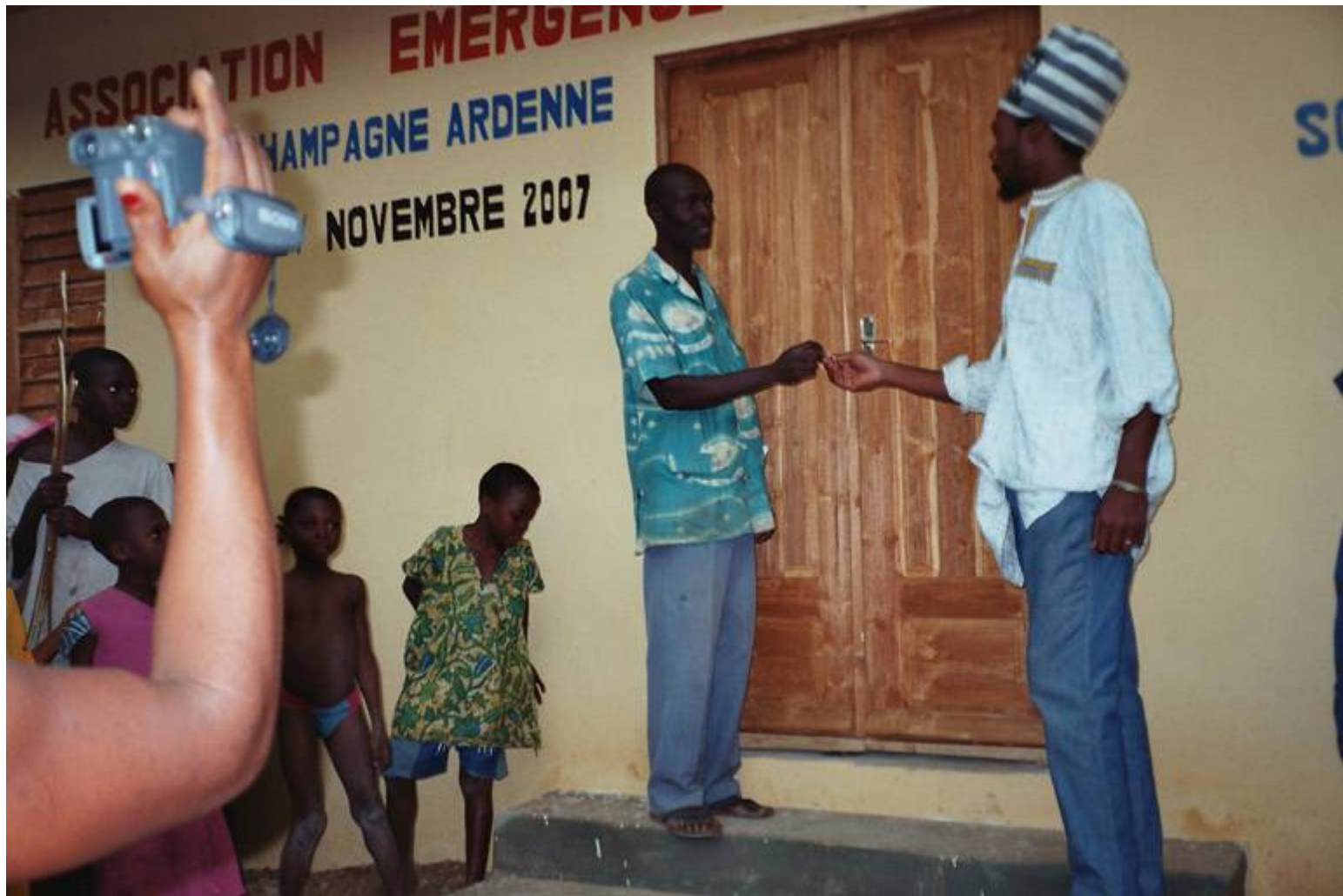
Remise officielle des clés au président de l'APE de Hon, ...