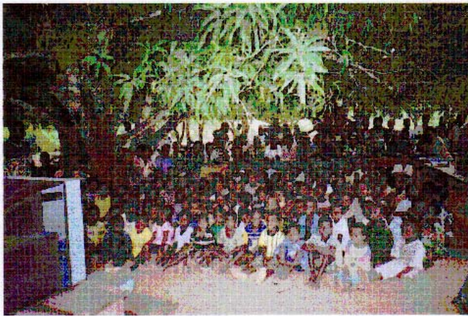
Projection avec les villageois de Hon du reportage, relatif au projet Bénin/Marne/Afrique, réalisé par France

° évaluer, techniquement et financièrement, avec les partenaires locaux, le projet de construction de la bibliothèque du village de Hon.